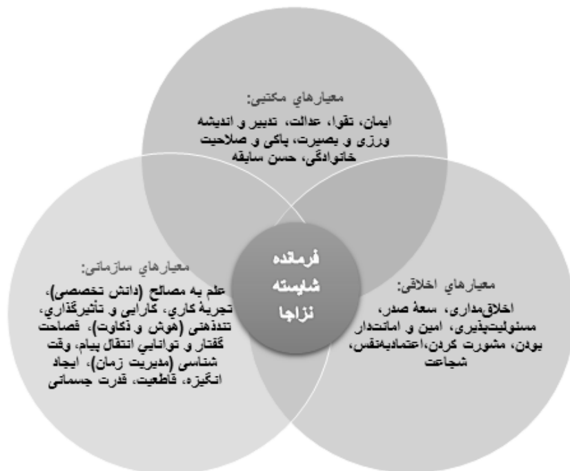
شکل شماره ۲: معیارهای شایسته‌گزینی فرماندهان نزاجا با تمرکز بر آموزه‌های نهج‌البلاغه