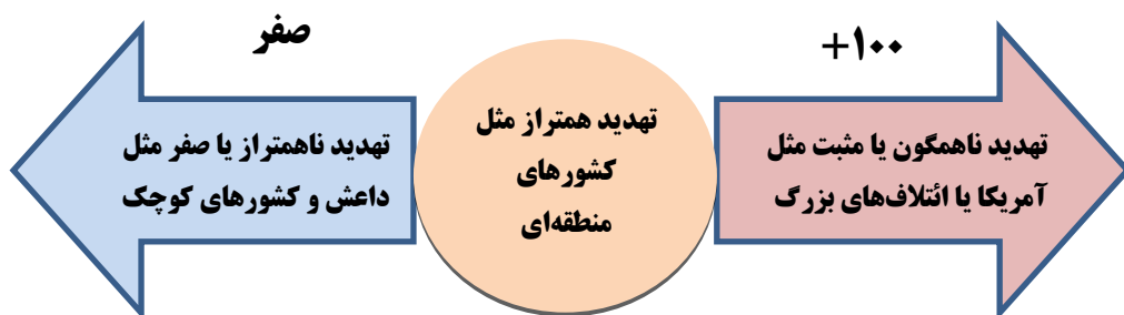
شکل شماره ۱: طیف تهدیدهای نظامی

کوچک مثل داعش و برخی از کشورهای همسایه هستند. به سمت وسط طیف تهدیدات منطقه‌ای هم‌تراز قرار دارند؛ مثل عربستان سعودی، ترکیه و ... هر چه به راست طیف برویم، تهدیدات ناهمگون و قوی‌تر مثل آمریکا و ناتو قرار دارند. بنابراین ج.ا.ایران بر خلاف سایر کشورها در هر دو سر طیف مورد تهدید است، پس هم نیاز به گردان جهت سر منفی طیف دارد و هم نیاز به لشکر جهت سر مثبت طیف دارد.