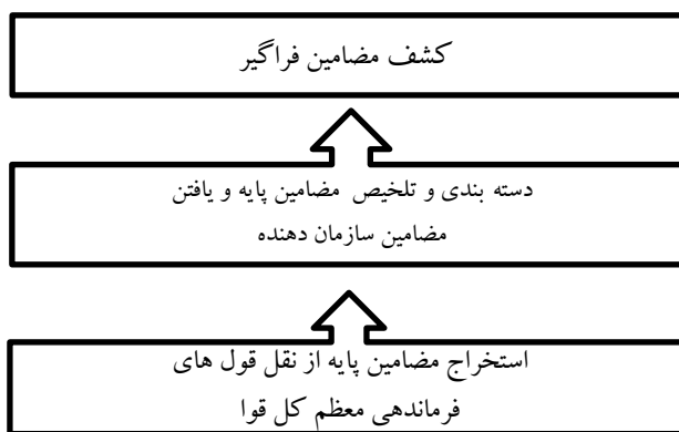
شکل ۱: الگوریتم تحقیق مطابق با شبکه مضمون آتراید-استیرلینگ

الگوریتم این تحقیق مطابق با شکل زیر با روش شبکه مضامین از روش‌های تحلیل مضمون ارائه می‌شود: