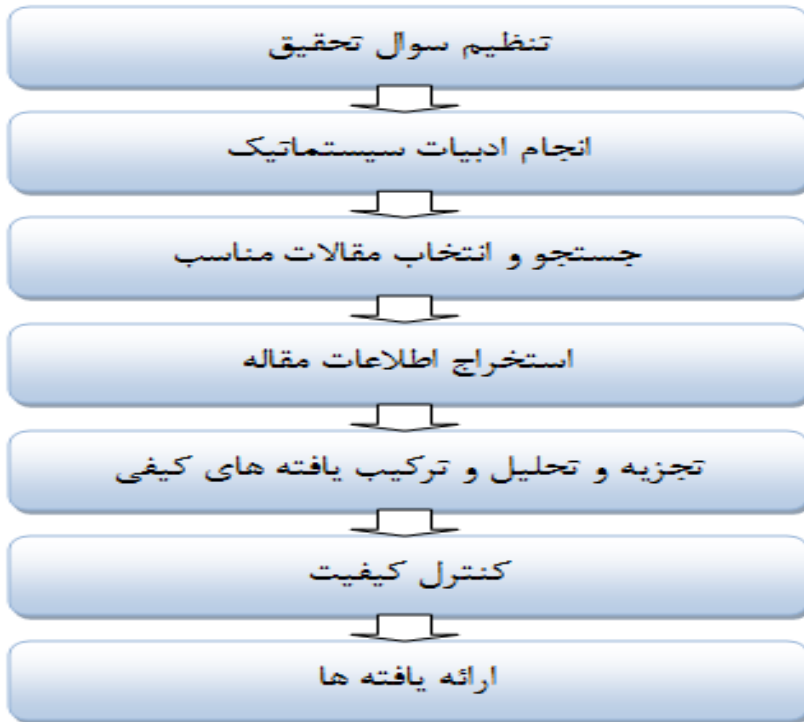
شکل ۲: گام‌های فراترکیب

در این تحقیق از روش «فرا ترکیب» برای ارائه الگوی مطلوب فرماندهی از منظر اسلام و بیانات رهبری (مدظله‌العالی) استفاده شده است. برای گردآوری داده‌های تحقیق، از داده‌های ثانویه به نام اسناد و مدارک گذشته استفاده شده است. این اسناد و مدارک شامل تمامی پژوهش‌های صورت گرفته (اعم از پژوهشی و مروری) در زمینه تحقیقات ارائه الگوی فرماندهی از منظر اسلام و بیانات رهبری (مدظله‌العالی) بوده است. این نحوه گردآوری داده‌ها به تحلیل اسنادی نیز معروف است. در فرا ترکیب متن پژوهش‌های گذشته (اعم از مروری و پژوهشی) به‌عنوان داده‌ها محسوب می‌شود که دقیقاً همانند متن مصاحبه مستند شده است.