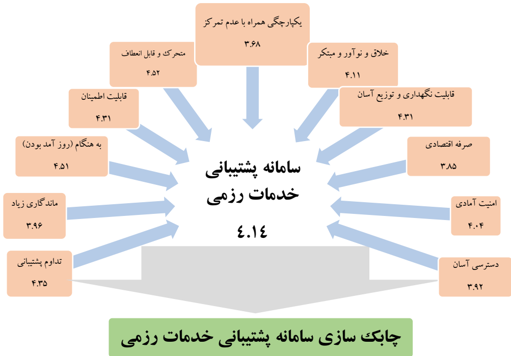
شکل ۱: مؤلفه‌های چابکی سامانه رزم پشتیبانی خدمات رزمی

در این الگو وزن موزون هر مؤلفه در کنار آن و نیز وزن موزون سامانه ارائه شده است. همانگونه که در الگو مشخص است میزان تأثیرگذاری هر مؤلفه در چابک‌سازی سامانه مذکور در رزم زمینی با نگرش به تهدیدات آینده بسیار قابل ملاحظه است. همچنین میزان اثرگذاری برخی از مؤلفه‌های این سامانه در حد بالا و برخی دیگر متوسط است. با توجه به وزن موزون استاندارد شدهی مؤلفه‌ها مشاهده می‌شود که مؤلفه‌های متحرک و قابل انعطاف، به هنگام (روز آمد بودن) نسبت به سایر مؤلفه‌ها از اهمیت بالاتری برخوردارند.