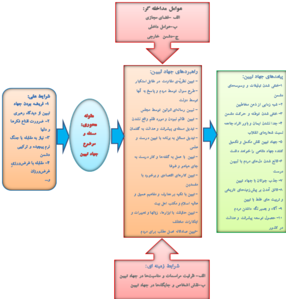
شکل شماره (۲): الگوی اندیشه فرماندهی معظم کل قوا (مدظله‌العالی) در خصوص جهاد تبیین