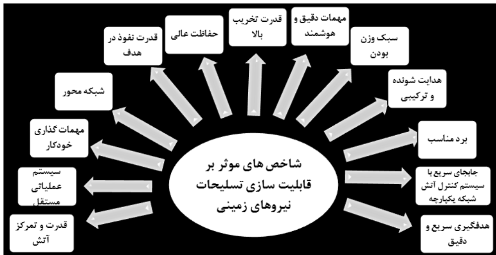
شکل ۲: چارچوب نظری تحقیق.

در ادامه این پژوهش با بررسی و مطالعه تطبیقی ۶ کشور (شامل کشورهای ترکیه، عربستان، پاکستان، رژیم صهیونیستی، روسیه و آمریکا) که کشورهای فرامنطقه‌ای، منطقه‌ای و رژیم غاصب صهیونیستی می‌باشند پرداخته شده است. علت این انتخاب، تهدیدات نظامی، پیشرفته بودن تسلیحات و رقابت‌های تسلیحاتی و منطقه‌ای است که این کشورها با کشورمان ایران دارند است. در این بررسی، تسلیحات نظامی نیروی زمینی که دارای قابلیت‌های پیشرفته‌ترین جنگ‌افزارهای که در حال حاضر در نیروی زمینی این کشورها سازماندهی شده است و مورد استفاده و بهره‌برداری قرار می‌گیرد بررسی شده است. این تسلیحات در چهار بعد تقسیم‌بندی گردید که شامل تسلیحات تیر مستقیم، تیر منحنی، هوا به زمین و مهندسی می‌باشند. تسلیحات تیر مستقیم شامل؛ سلاح انفرادی، سلاح کمری، تک‌تیرانداز، سلاح تیربار، سلاح‌های ضدتانک و تانک می‌باشند. در تسلیحات تیر منحنی شامل؛ خمپاره‌اندازها، توپخانه