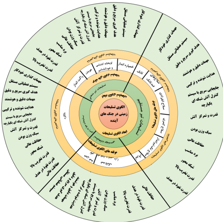
شکل ۴. الگوی مفهومی پیشنهادی تحقیق با استناد به یافته‌های نظری.