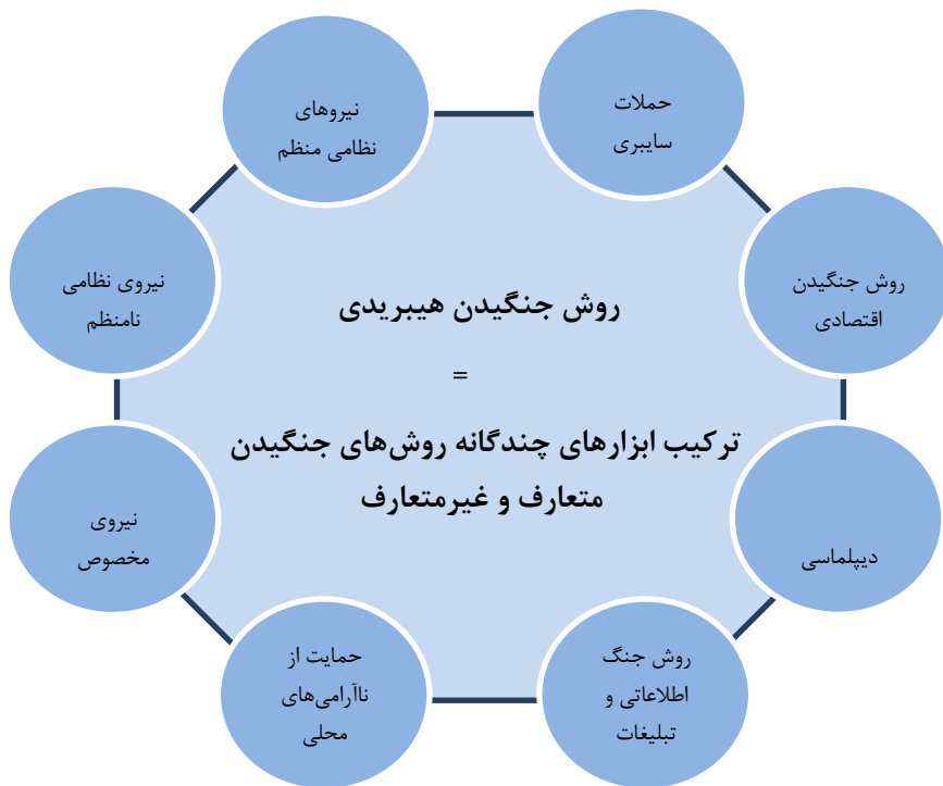
شکل ۲: روش جنگ هیبریدی از نظر کنفرانس امنیتی مونیخ

«طی دهه گذشته، ایالات متحده آمریکا همراه با متحدان بین‌المللی خود بر توان مقابله با تهدیدات نامنظم ناشی از بازیگران غیردولتی تا حد بسیاری افزوده است، اما طی همین سال‌ها یک چالش متمایز علیه آمریکا و شرکای این کشور در ناتو و حتی دیگر کشورها به واسطه ترکیب جدیدی از حملات نامنظم به وجود آمده است؛ این چالش جنگ هیبریدی با ترکیبی از ابزارهای متعارف، نامنظم و نامتقارن است. جنگ هیبریدی شامل استفاده یک بازیگر دولتی یا غیردولتی از همه ابزارهای در دسترس دیپلماتیک، اطلاعاتی، نظامی، اقتصادی با هدف ایجاد بی‌ثباتی در کشور هدف است.» (سایت چاهاراه، ۱۳۹۳).